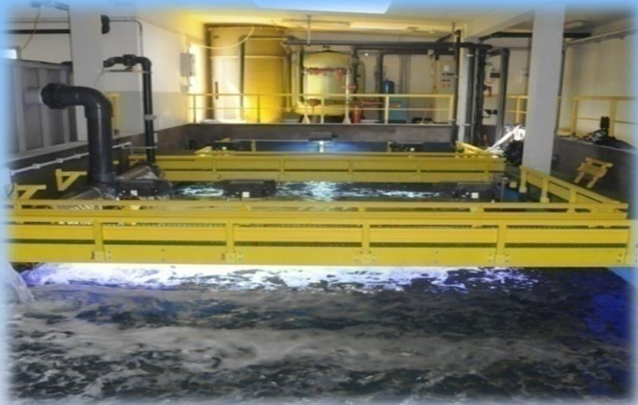
Locali tecnici dell'Acquario di Cala Gonone

Unite la visita tematica al percorso espositivo con la speciale visita ai locali tecnici della struttura... non perdetevi questa esperienza unica!