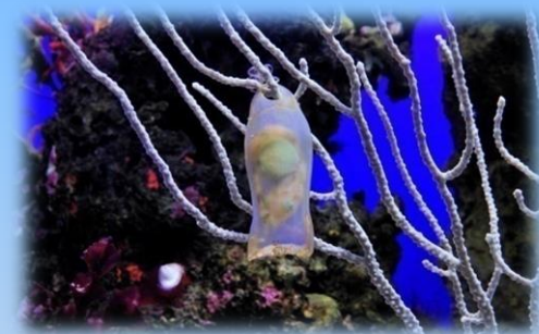
Le uova di gattuccio