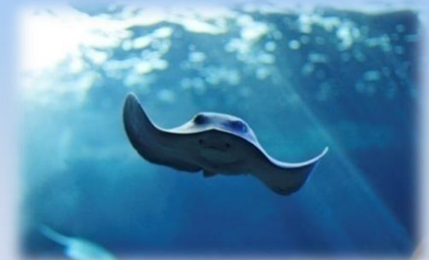
Il Trigone viola nella grande vasca pelagica