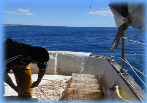
Pesca con le nasse

Sensibilizziamo i più piccoli su alcune tematiche di carattere ambientale ... conoscere è il primo passo per poter proteggere!!!