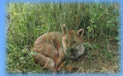
La volpe Rosa Fumetta

Il percorso, completato da un ampio parco giochi , si conclude con l'emozionante esperienza della vasca tattile , dove potrete interagire con razze, stelle marine, uova di squalo e paguri.