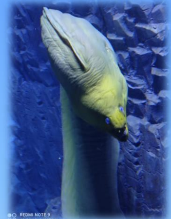
Clotilde, la murena gigante

Conoscere le principali caratteristiche del nostro mare e la vita dei suoi abitanti è il primo passo per poterlo rispettare.