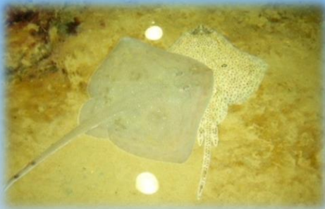
Le razze della vasca tattile

Questa visita permette di acquisire nozioni generali sulle 300 specie di organismi ospitati nel nostro acquario,