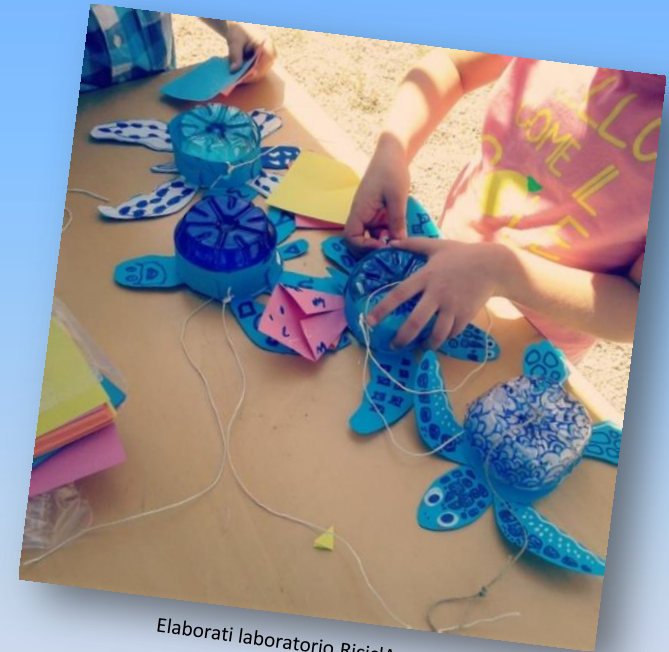
Elaborati laboratorio RiciclAcquario

Per prenotazioni, info e per richiedere delle variazioni al calendario dei laboratori contattare il numero 0784/920052