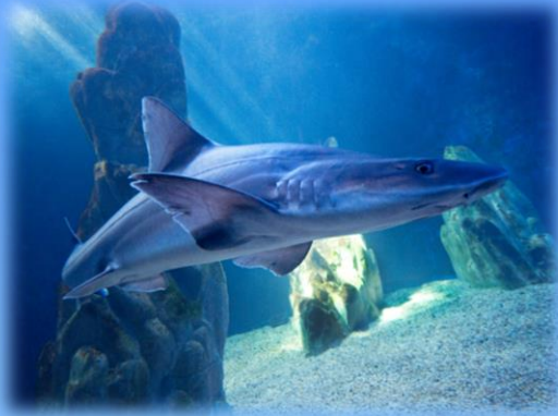
Lo squalo palombo

Conoscere le principali caratteristiche del nostro mare e la vita dei suoi abitanti è il primo passo per poterlo rispettare.