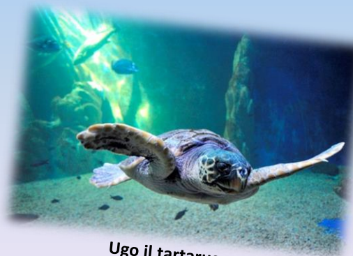
Ugo il tartarugo