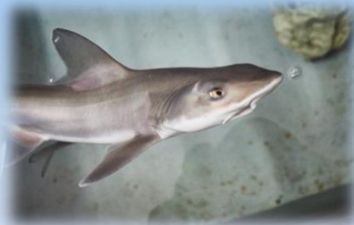
Ispira, squalo nato per partenogenesi