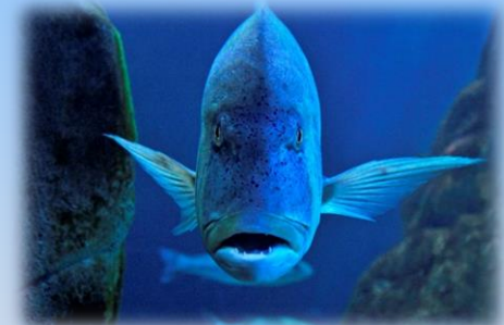
Il dentice, predatore nella grande vasca

Questa visita permette di acquisire nozioni generali sulle 300 specie di organismi ospitati nel nostro acquario,