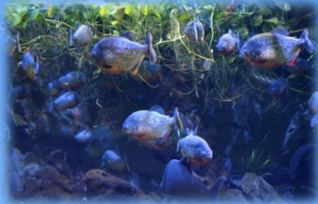
La vasca de Piranha

25 vasche espositive vi aspettano per farvi conoscere le specie tipiche del Mediterraneo : Ugo la tartaruga marina cieca vittima dell'inquinamento dei nostri mari, la volpe Rosa Fumetta salvata da un incendio boschivo ad Oristano nel maggio 2017, Freezer , la tartaruga alligatore dalla storia difficile, Clotilde , la murena gigante che si nasconde nella sua tana, Ispira , lo squalo nato per partenogenesi e molti altri amici, come i pesci Piranha e i coloratissimi pesci tropicali .